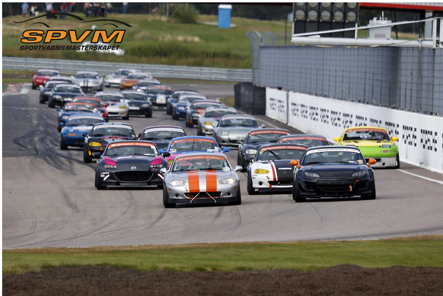
Oljemagasinet MX-5 Cup