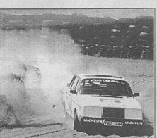
Hoppens på det kan gå Volvo Original i action.