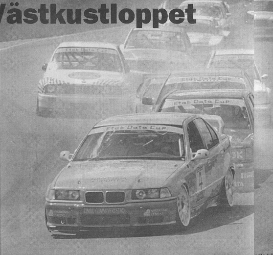
Thomas Nyström kniper starten före Mikael Dahlgren, Villy Zielenksi och resten av startfältet i Väst kustloppet.