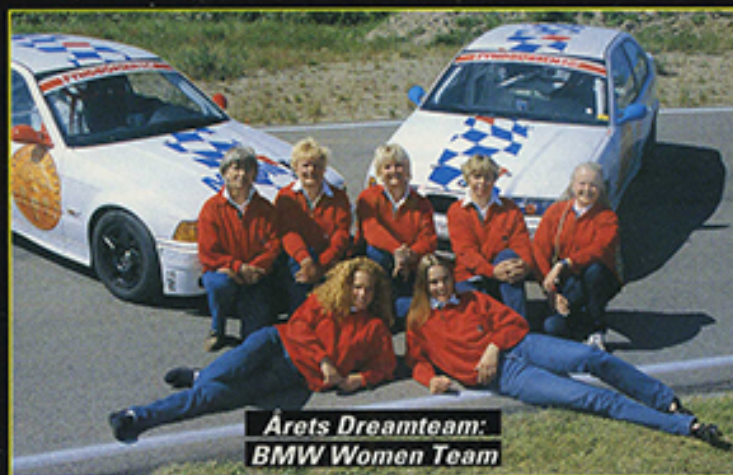
Årets Dreamteam: BMW Women Team