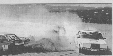
Hoppens på det kan gå Volvo Original i action.