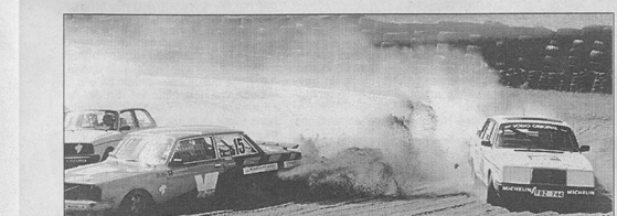
Hoppens på det kan gå Volvo Original i action.