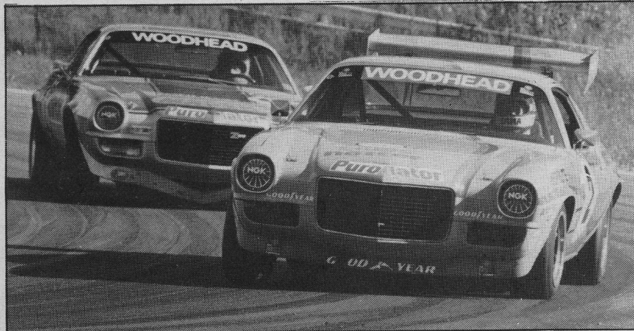
Bilarna i turordning som de placerade sig i mål. "Emma" före Picko.