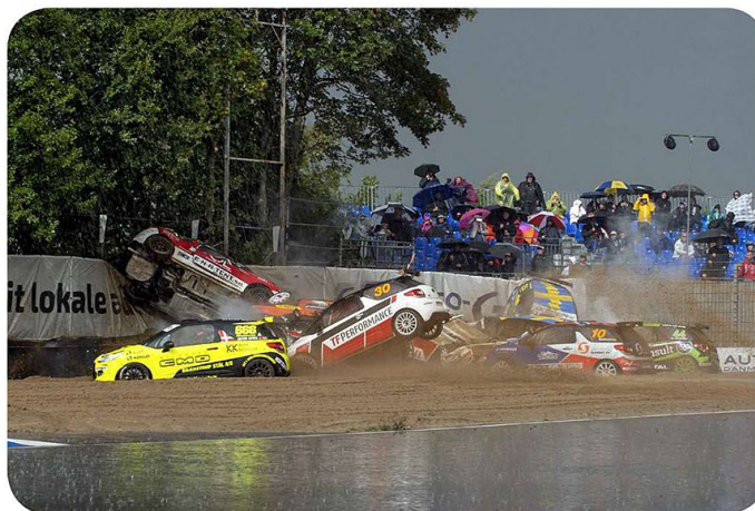
Katastrofracet för DS3 Cup när de körde Danmarks GP på Jyllandringen. Det kom ett häftigt skyfall och elva bilar fick vattenplaning däribland samtliga svenskar!