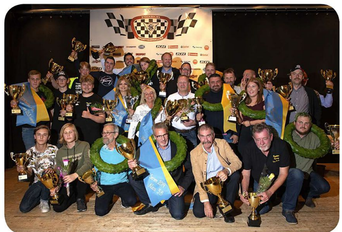
Alla pristagare i SSK-Serien samlade på en gång.