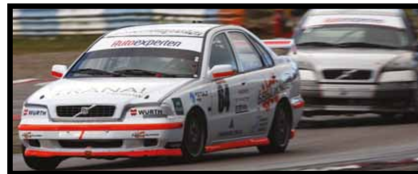
Macka jagas av Jimpa.