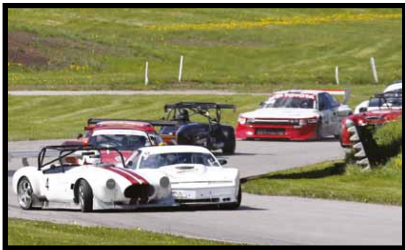
Tuff fight i Modsport.