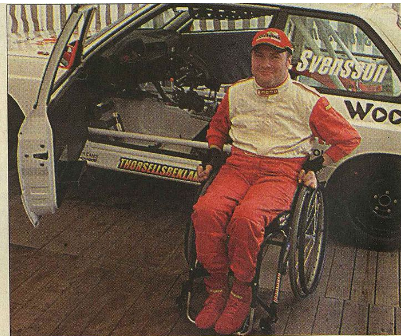
Tillbaka i hetluften med specialbyggd bil.