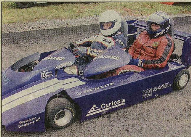
Tvåsitigt Superkart är en ovanlig syn.