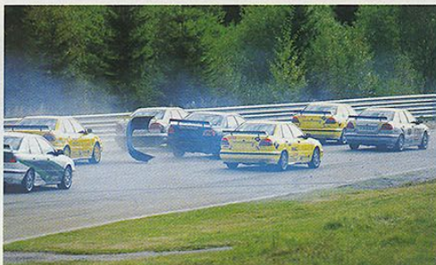
S40 Challenge ser precis ut som sin föregångare JTCC. Tuffa fighter och plastbitarna yr. På måndagen gnuggar Volvo-cheferna sina händer då de får sälja massor av reservdelar.