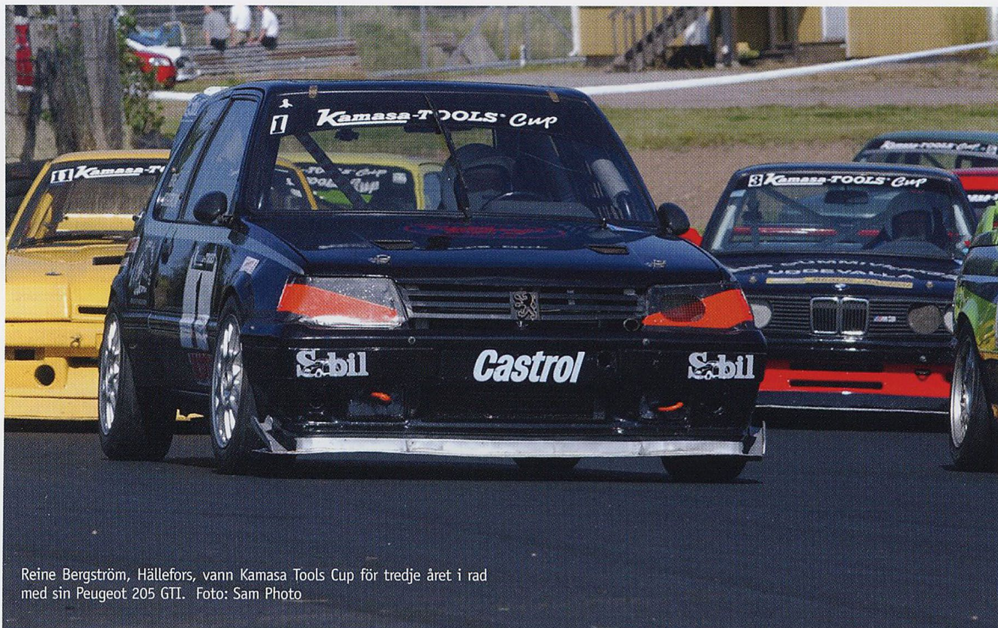
Reine Bergström, Hällefors, vann Kamasa Tools Cup för tredje året i rad med sin Peugeot 205 GTI.