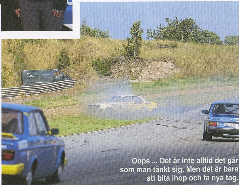
Oops ... Det är inte alltid det går som man tänkt sig. Men det är bara att bita ihop och ta nya tag.