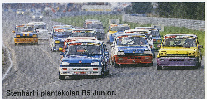
Stenhärt i plantskolan R5 Junior.