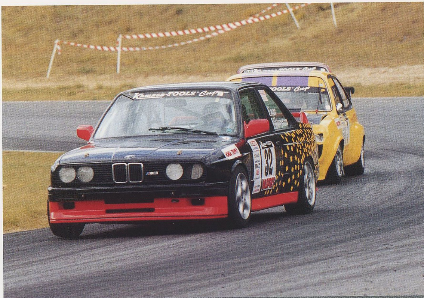
Enar Viktorsson tätt följd av Gunnar Olårs i Kamasa Tools Cup den 17/9.

med i andra racingklasser framöver. Redan under 2001 återfinns ett par av förarna i seniorklasser.