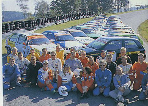
TALANGKLASSEN. Fyndbörsen Cup som samlade 40 tävlande bilar i år är SSK-seriens största klass. Drygt hälften av teamen deltog i årets final. Det är här talangerna fostras för större uppgifter inom svensk racing.

— Sen var det kört, berättade han efter målgång. Vatten gick in i